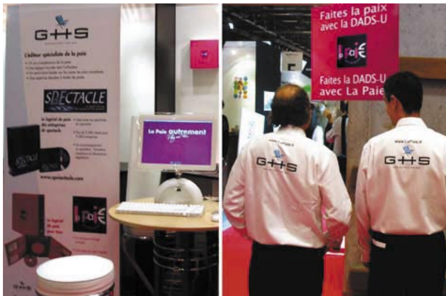
Apple Expo 2005 : un stand multicolore et un staff plutôt fier de son slogan !

En dehors des formations, les occasions de nous rencontrer sont peu nombreuses ! Apple Expo fournit chaque année une opportunité d'échange qui a l'avantage de la régularité. Vous êtes encore nombreux à avoir visité le stand GHS pour cette édition 2005 et nous vous en remercions. Il est vrai que la présentation en avant-première de la "version DADS-U" a suscité une incontestable curiosité. Nous étions particulièrement motivés pour vous exposer le casting et le scénario de ce nouveau sPAIEctacle. Du côté du logiciel La Paie, c'est sur le thème "faites la paix avec la DADS-U, faites la DADS-U avec La Paie" que nous avons poursuivi le travail d'implantation inauguré en 2003.