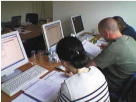
Une formation à Marseille, en juin 2005

Après le succès de sa tournée de printemps, la caravane GHS reprend la route pour une tournée d'hiver spéciale "États de fin d'année". Rien de tel pour bien commencer l'année que des états de fin d'année réussis, d'autant que 2006 sera spécifique, DADS-U oblige !