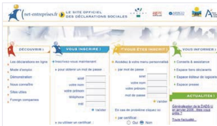
Pour transmettre votre DADS-U par Internet, vous devez préalablement vous inscrire sur www.net-entreprises.fr

Oui, le mode de fonctionnement de sPAIEctacle permet justement de générer automatiquement autant d'enregistrements salarié que nécessaire. La DADS-U sera donc rapidement opérationnelle après l'installation de la nouvelle version.